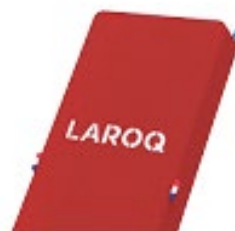
ROUGE CINABRE Logo blanc