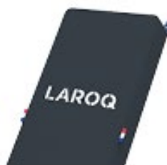
GALET Logo blanc