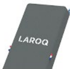
GRIS PERLE Logo blanc