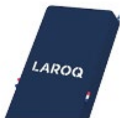
SAPHIR Logo blanc

Nuancier avec 12 coloris pour une personnalisation sur-mesure