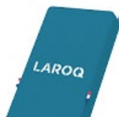
BLEU OPALE Logo blanc