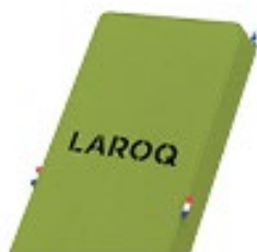
VERT POMME Logo noir