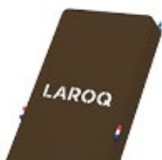
HAVANA Logo blanc