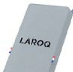
BRUME Logo noir