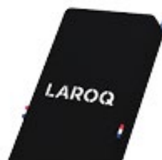
NUIT Logo blanc