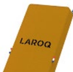
VENITIEN Logo noir