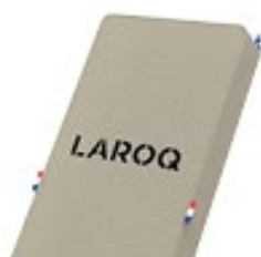
DESERT Logo noir