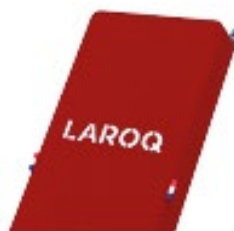
ROUGE CARMIN Logo blanc